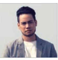
JAY'ED クリスマスナイト・セレモニー 12/25 Sun 18:00~20:00