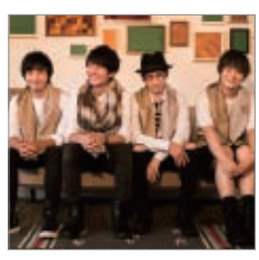
Goodbye holiday オープニングセレモニー 12/1 Thu 17:45~

プレミアムレッドツリー点灯時間 毎日18:30、19:30、20:30から約15分間